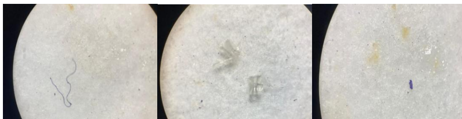
Gambar 1. Bentuk Mikroplastik Pada Saluran Pencernaan Ikan Amoy (1) Fiber, (2) Fragment, (3) film

Berdasarkan hasil identifikasi bentuk mikroplastik menggunakan mikroskop stereo didapatkan beberapa bentuk mikroplastik yang dapat dilihat pada Gambar 1.